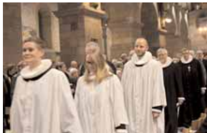
Fra Hans' ordination i Viborg Domkirke

den. Ordinanderne aflagde præsteløftet, hvorved de lover at gøre deres bedste for at udfylde en præsts opgaver - at forkynde, vejlede, trøste og studere "efter den nåde, som Gud mig dertil vil give". Endelig lagde biskoppen, de øvrige præster og repræsentanter for de nye præsters menigheder hånd på disses hoveder og bad Gud om at antage dem som sine tjenere. Herefter kunne de ny præster, netop fordi de nu var præsteviede, uddele brød og vin ved nadveren.