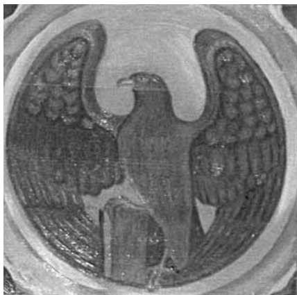
Johannes symboliseres ved en ørn

I vores kirke findes de fire evangelistsymboler på gelænderet foran orglet.