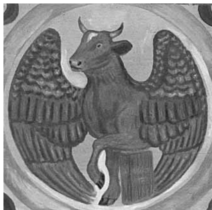
Lukas symboliseres ved en okse