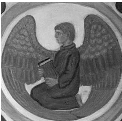
Mattæus symboliseres ved et englemenneske