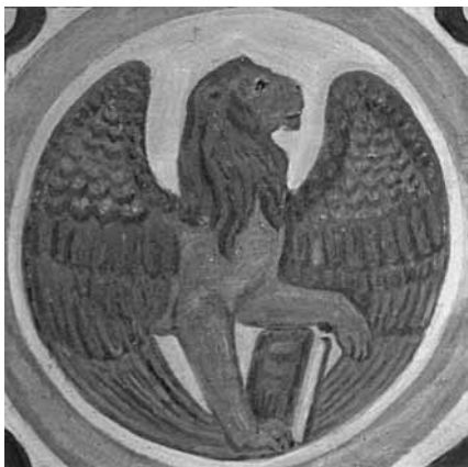
Markus symboliseres ved en løve

Neden under er fotografi af evangelistsymbolerne i Valgmenighedskirken.