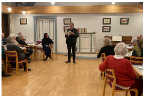
Forfatteraften med den islandske forfatter Einar Már Guðmundsson