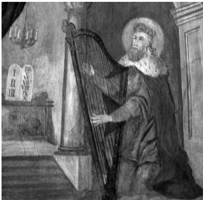
Kong David med harpen

Gud havde lagt mærke til David og sagde en dag til en mand, der hed Samuel: "Der er en hyrdedreng, der hedder David. Han har et godt hjerte. Det er en god egenskab for en konge. Jeg har bestemt, at David skal være konge engang, og at du skal udpege ham til konge" . Nu var det sådan, at Gud ville, at